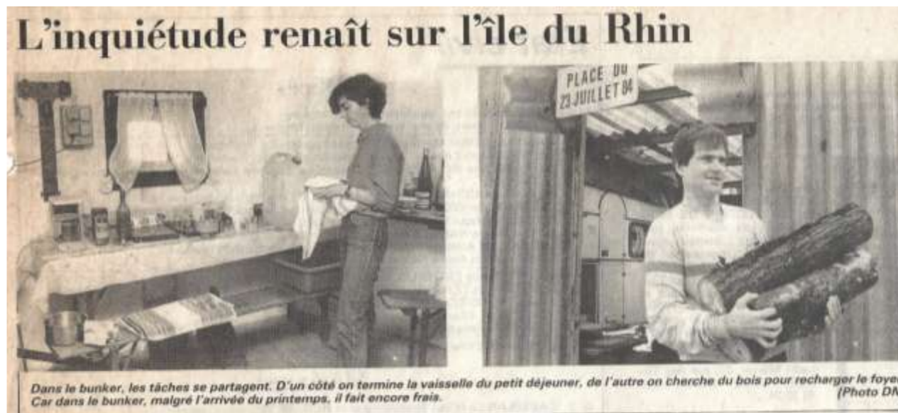
Dans le bunker, les tâches se partagent. D'un côté on termine la vaisselle du petit déjeuner, de l'autre on cherche du bois pour recharger le foyer. Car dans le bunker, malgré l'arrivée du printemps, il fait encore frais.

Suite à la ratification de la convention de Bonn par le parlement néerlandais, l'inquiétude revient dans le bunker de l'île du Rhin et la défense se renforce.